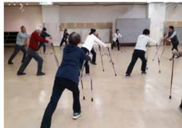
ポールで準備運動