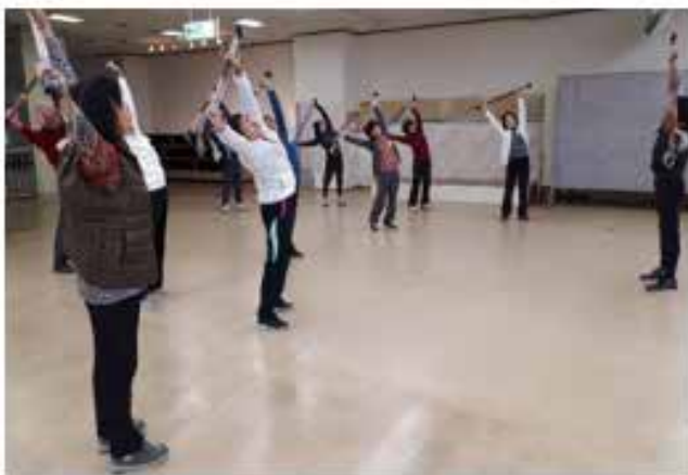
ポールで準備運動