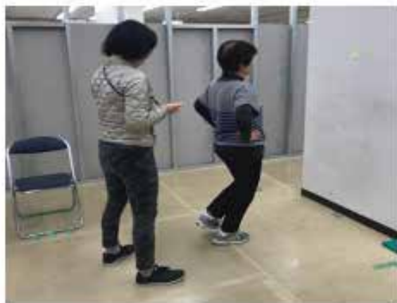
開眼・閉眼片足立ち