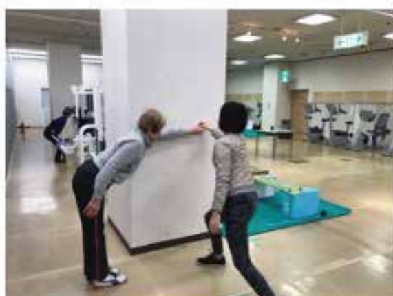
ファンクショナルリーチ